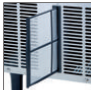
邻近的冷凝器风扇滤网